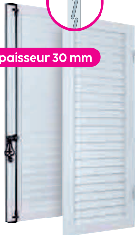
Volet à lames Américaines extrudées NON ISOLÉ