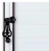
Espagnolette en Aluminium

Lames isolantes en mousse de polystyrène extrudé haute densité et de deux parements Aluminium pré-laqué