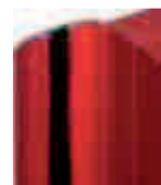
Battement + joint