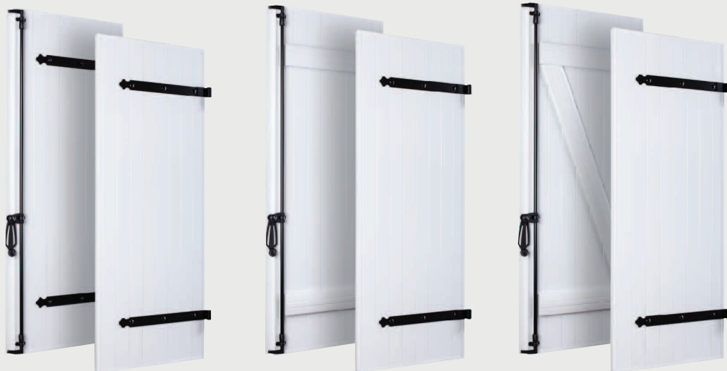
Pentures et contre-pentures