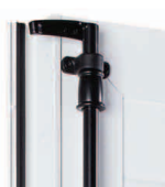
Joint sur battement