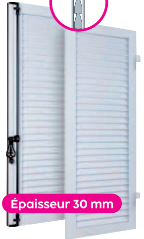
Volet à lames jointives extrudées NON ISOLÉ