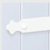
Penture en Aluminium blanc à bout festonné