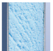
Structure en Aluminium isolé, épaisseur 27 mm R = 0,28

Coefficient de résistance thermique de \Delta R=0,28