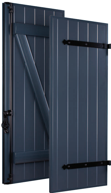
Penture et contre-pentures ou barres et écharpes