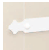
Penture en Aluminium blanc ou noir à bout festonné