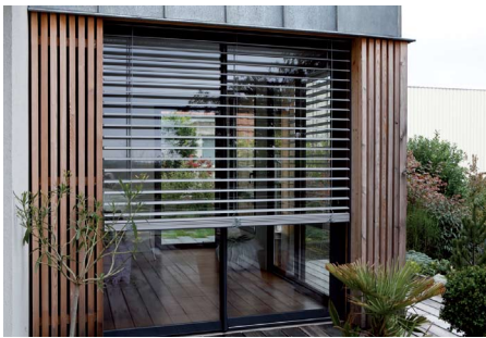
BRISE-SOLEIL ORIENTABLE À lacettes