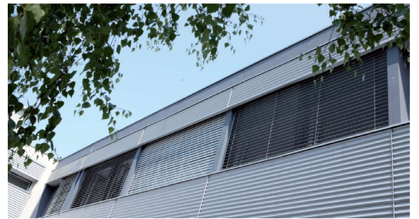
BRISE-SOLEIL ORIENTABLE Monobloc à pose rapide

L'alliance du confort et de l'esthétisme !