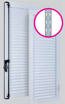
Lames jointives extrudées Non isolé