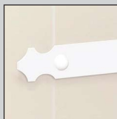
Penture en Aluminium blanc ou noir à bout festonné