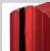
Battement + joint