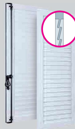
Lames Américaines extrudées Non isolé